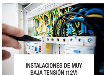
INSTALACIONES DE MUY BAJA TENSIÓN (12V)

Contacte con nuestro departamento comercial para obtener más información y consultar descuentos.