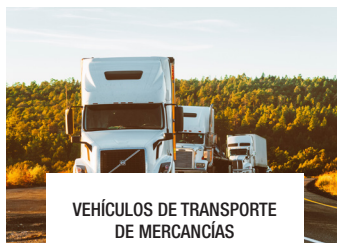
VEHÍCULOS DE TRANSPORTE DE MERCANCÍAS