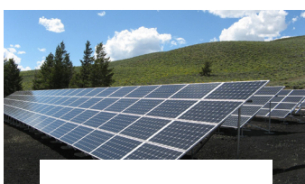
INSTALACIONES CON PANELES SOLARES